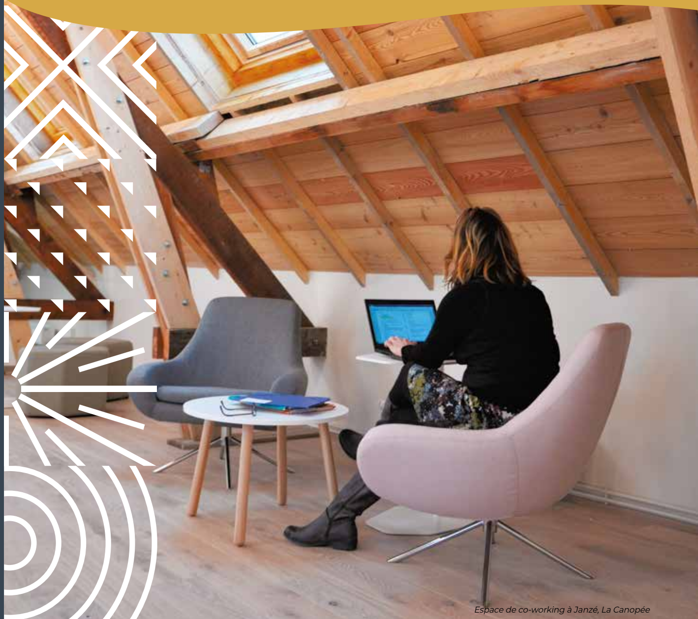
Espace de co-working à Janzé, La Canopée