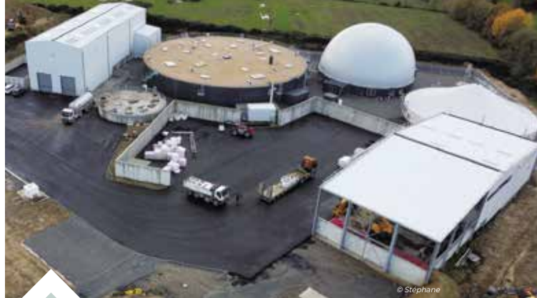
Vue aérienne de la centrale de méthanisation

La production de gaz, sera injectée dans le réseau local - l'équivalent de 90 % de la consommation des habitants