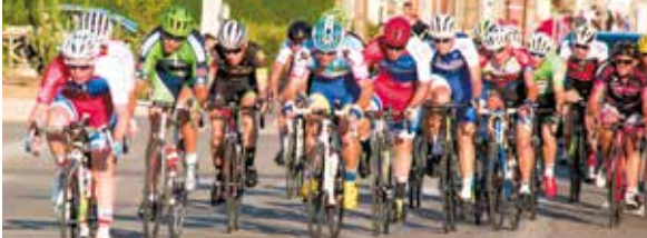
Tour de France à Janzé.